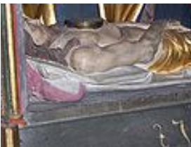
Grabchristus von 1504 mit Hostienbehältnis in der Kirche St. Peter und Paul in Obernai/Elsass

In vielen Gotteshäusern wird das Heilige Grab aufgestellt, um das Leiden und Sterben Jesu deutlich zu machen. Freiwillige bauen die Grabstätte Jesu vor dem Hochaltar auf und ist in den vorösterlichen Tagen ein Schmuckstück des Gotteshauses.